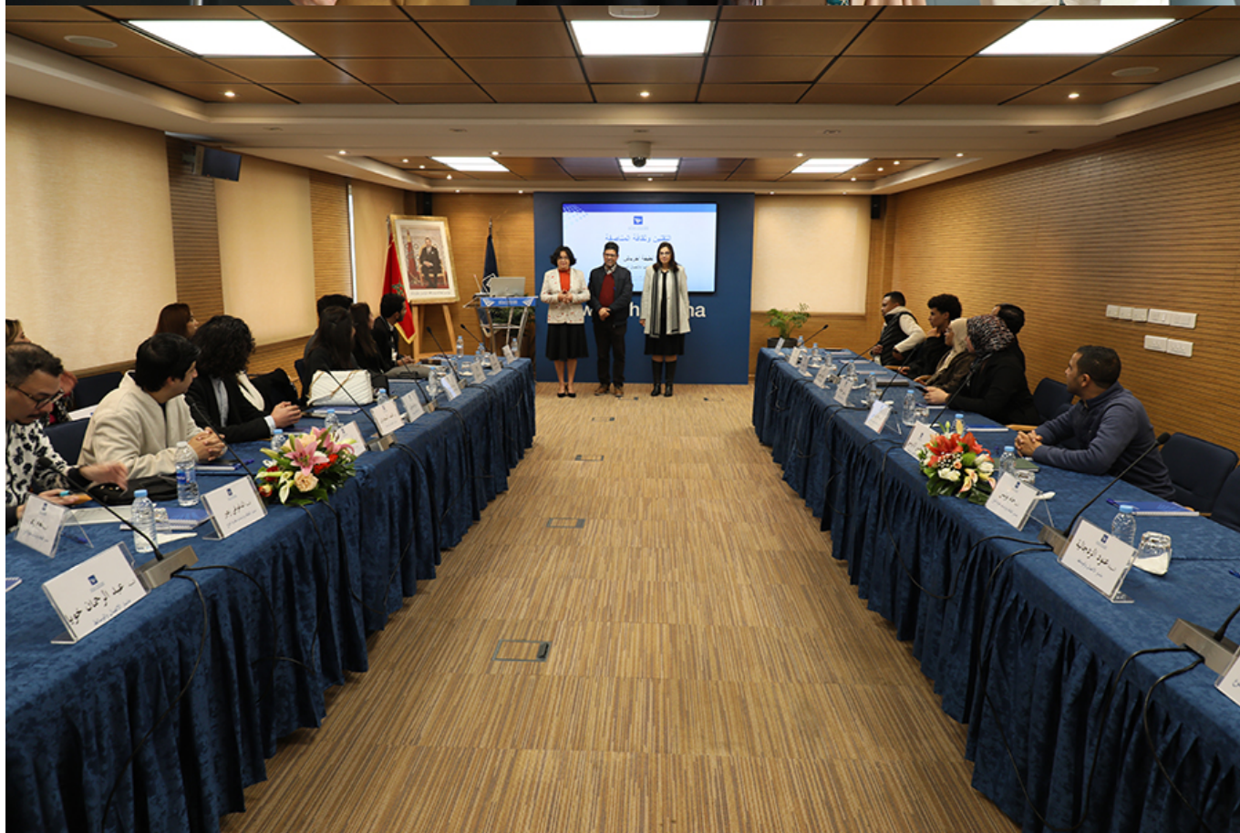
La Haute Autorité de la Communication Audiovisuelle a organisé le 09 mars 2023 à son siège à