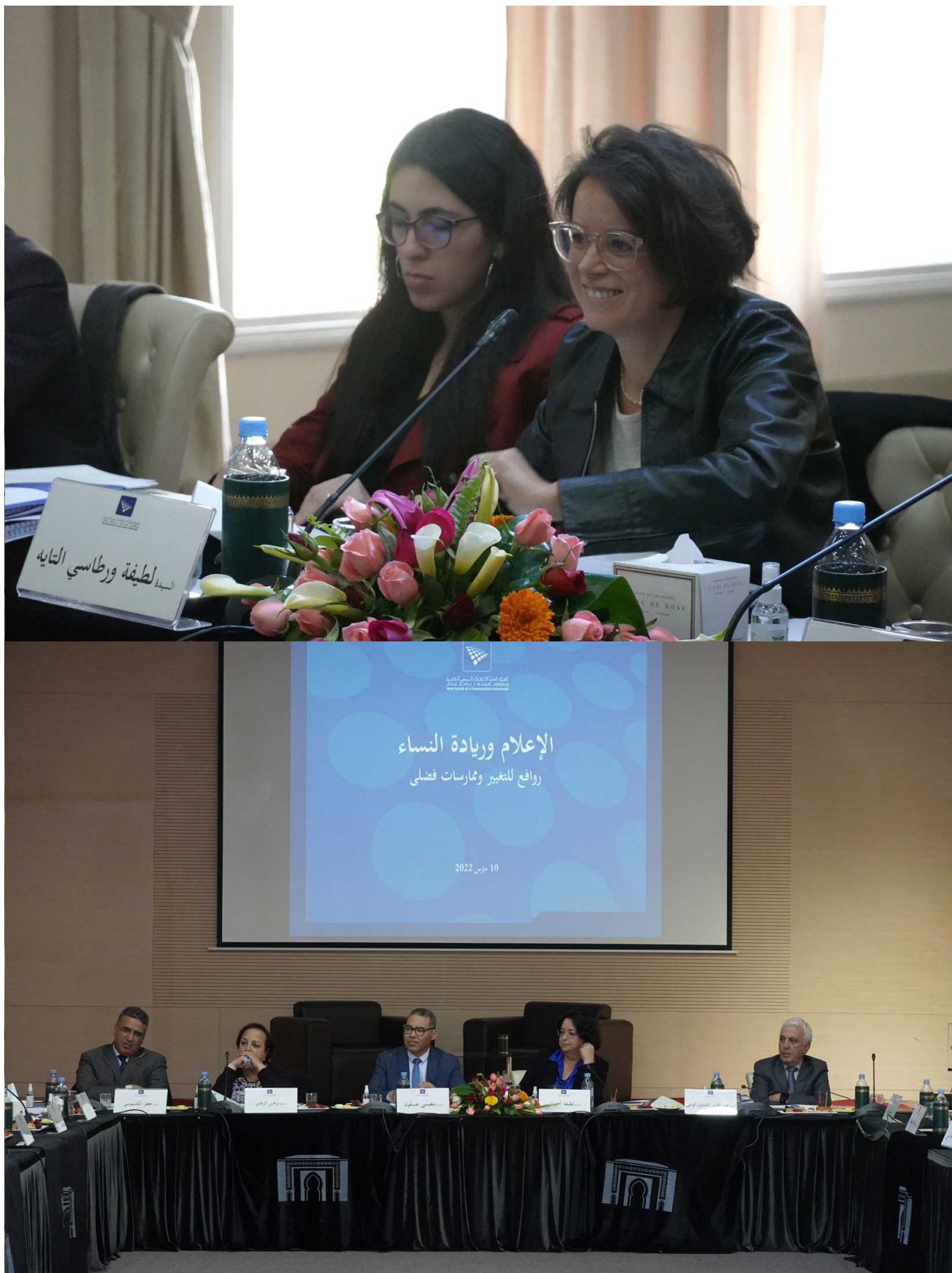
A l'occasion de la Journée Internationale des Droits des Femmes, la Haute Autorité de la Communication Audiovisuelle -HACA- a organisé le 10 mars 2022, un atelier interactif sur le