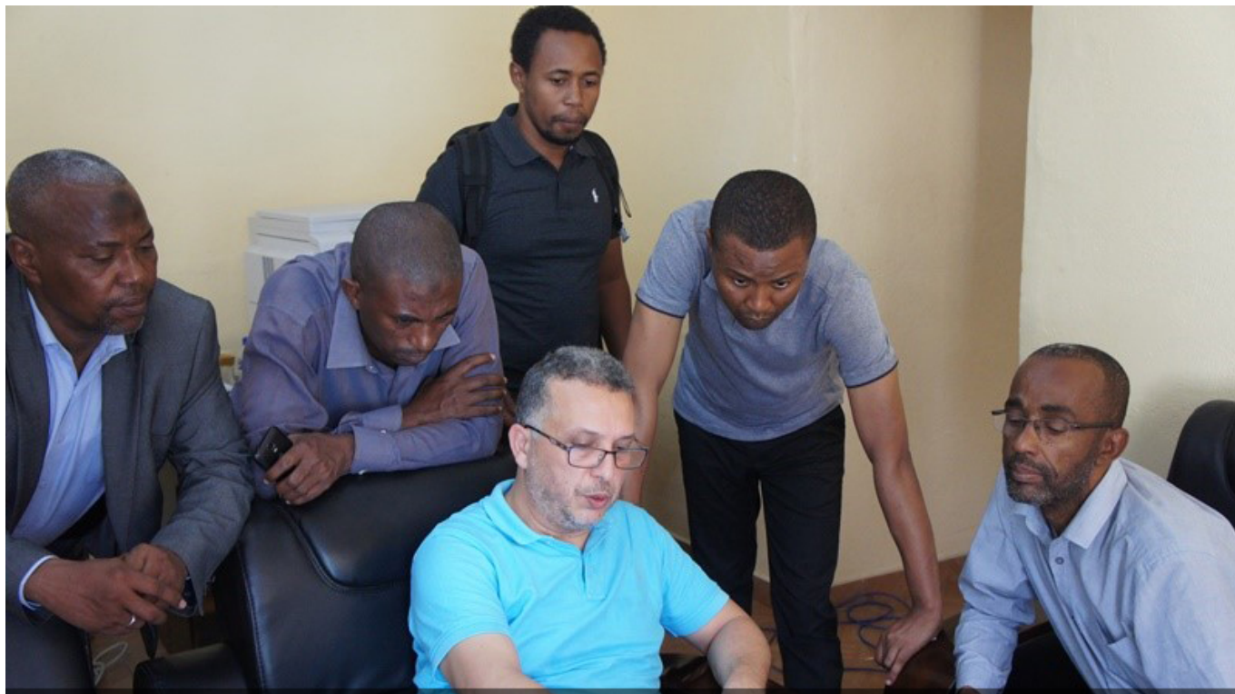
Démonstration à distance des outils HACA de reporting