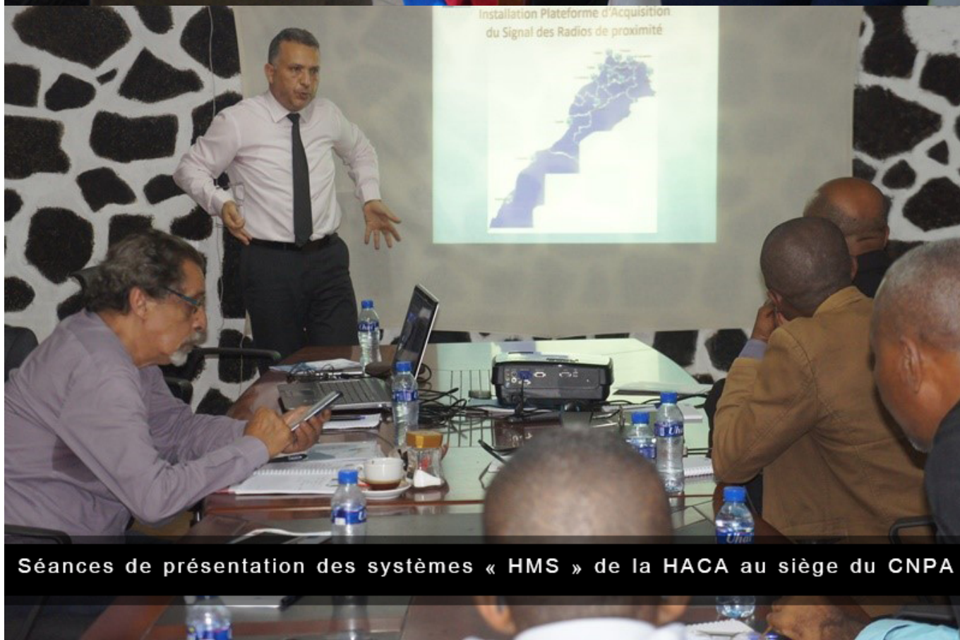
Séances de présentation des systèmes « HMS » de la HACA au siège du CNPA