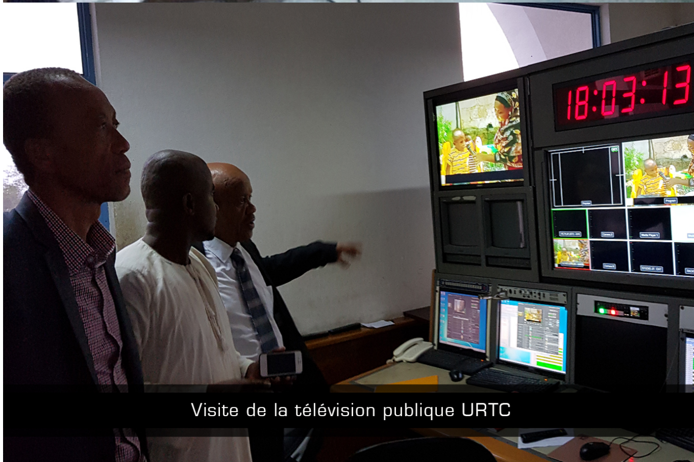
Visite de la télévision publique URTC