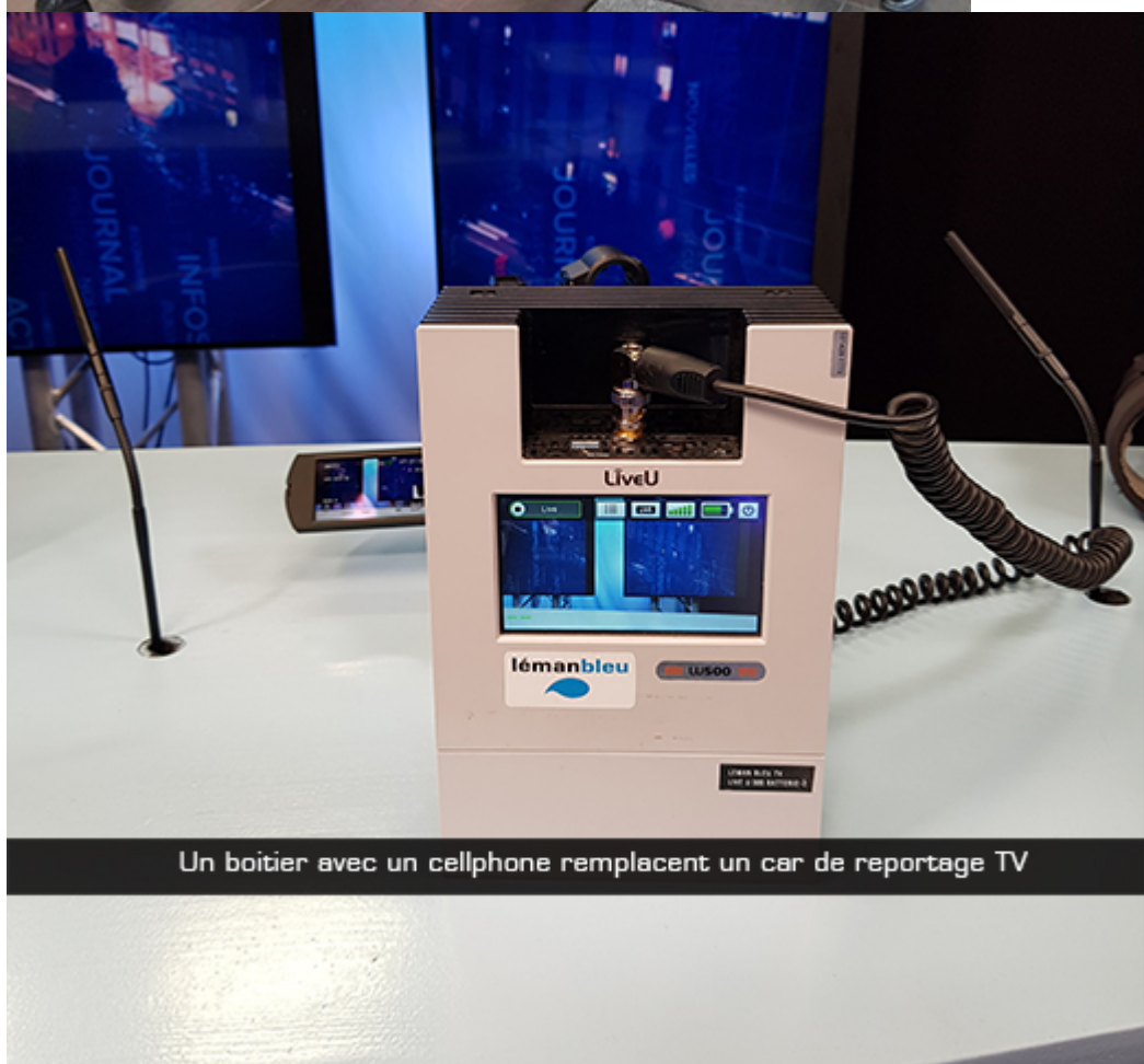
Un boîtier avec un cellphone remplace un car de reportage TV

Dans le cadre de sa stratégie d'ouverture, d'échange d'expériences et d'expertise, la Direction Générale de la Haute Autorité de la Communication Audiovisuelle a effectué, une immersion dans le secteur audiovisuel suisse à Genève (600.000 habitants) et à Bienne (50.000 habitants) les 05 et 06