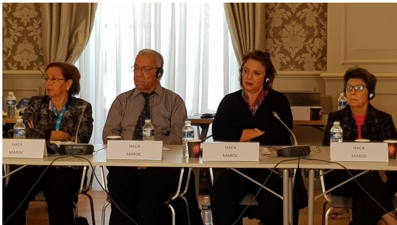
La délégation de la HACA au cours des travaux de la 19 ème assemblée plénière du RIRM

A l'issue de l'assemblée plénière, la vice-présidence entrante a été confiée au CAC catalan, qui organisera ainsi la 20 e assemblée plénière à l'automne 2018. La vice-présidence sortante est désormais assumée par la CNMC espagnole.