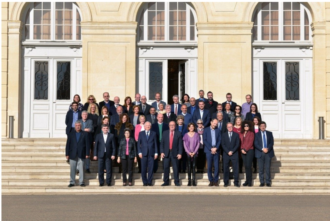
Photo de famille des participants